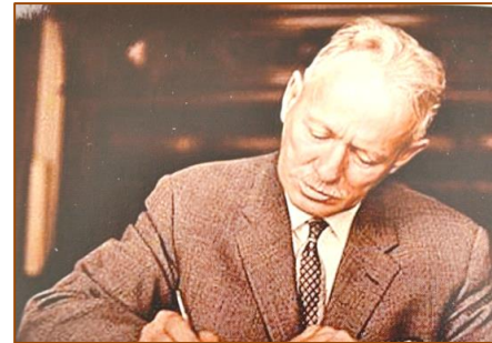
М.А. Шолохов восхищался талантом И. Сикорского – и как великого конструктора, и как лётчика-испытателя, и как философа. Сикорский в свою очередь высоко ценил роман «Тихий Дон», который ему подарил лауреат Нобелевской премии

примером тому является вертолётостроение в России, отрасль, которая находится среди лучших мировых образцов.